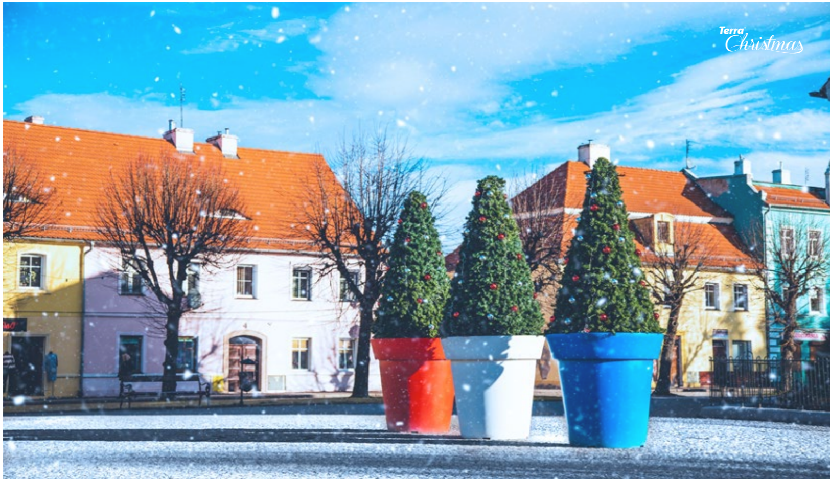
Weihnachtsüberzug Terra Christmas Tree & Blumentopf Gianto Classic 120 Terra Christmas Tree Cover & Gianto Classic pot

www.terrachristmas.de www.terrachristmas.com