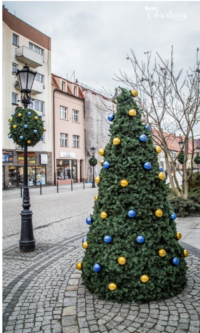
Weihnachtsüberzug Terra Christmas Tree & Weihnachtsüberzug Terra Christmas Ball Terra Christmas Tree Cover & Terra Christmas Ball Cover