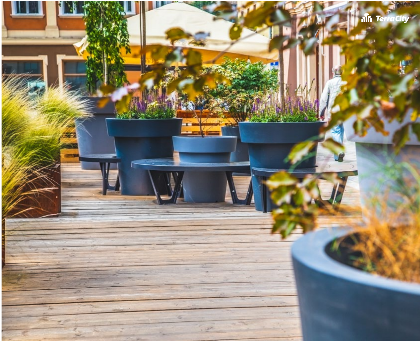
Set Triple für Gianto - Kollektion Wave Triple Set for Gianto - Collection Wave