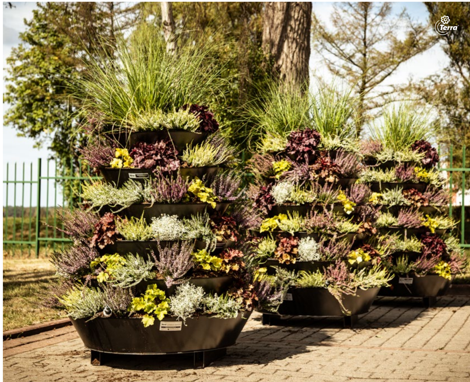
Blumentürme H1200 The Flower Towers H1200