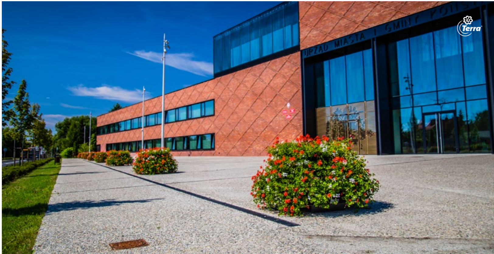
Blumentürme H700 The Flower Towers H700

www.blumentuerme.de www.terra-flower-tower.com