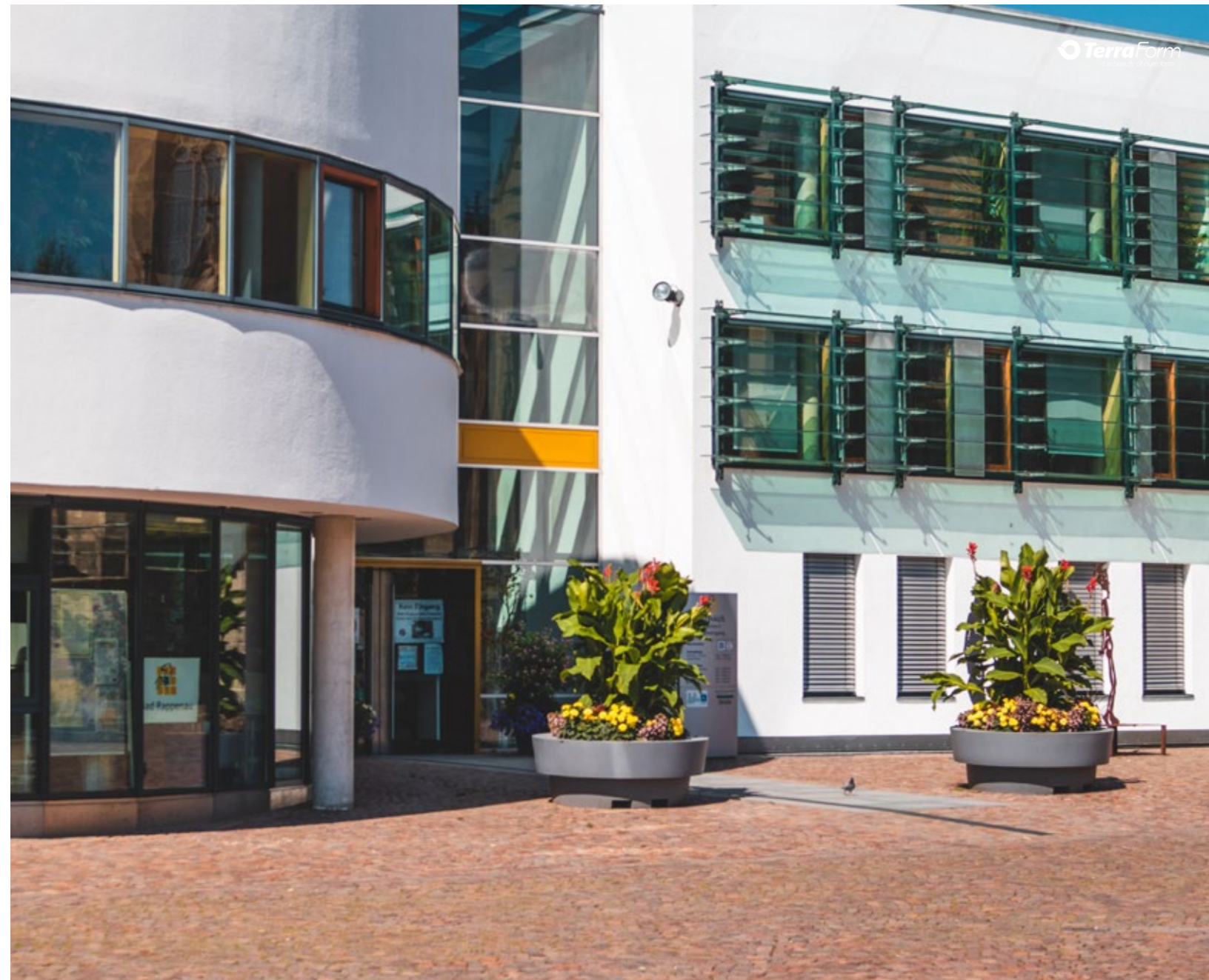
Blumentöpfe Gianto Sito Gianto Sito pots