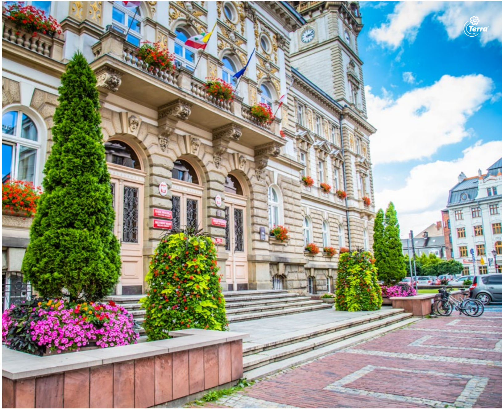
Blumentürme H2000 The Flower Towers H2000