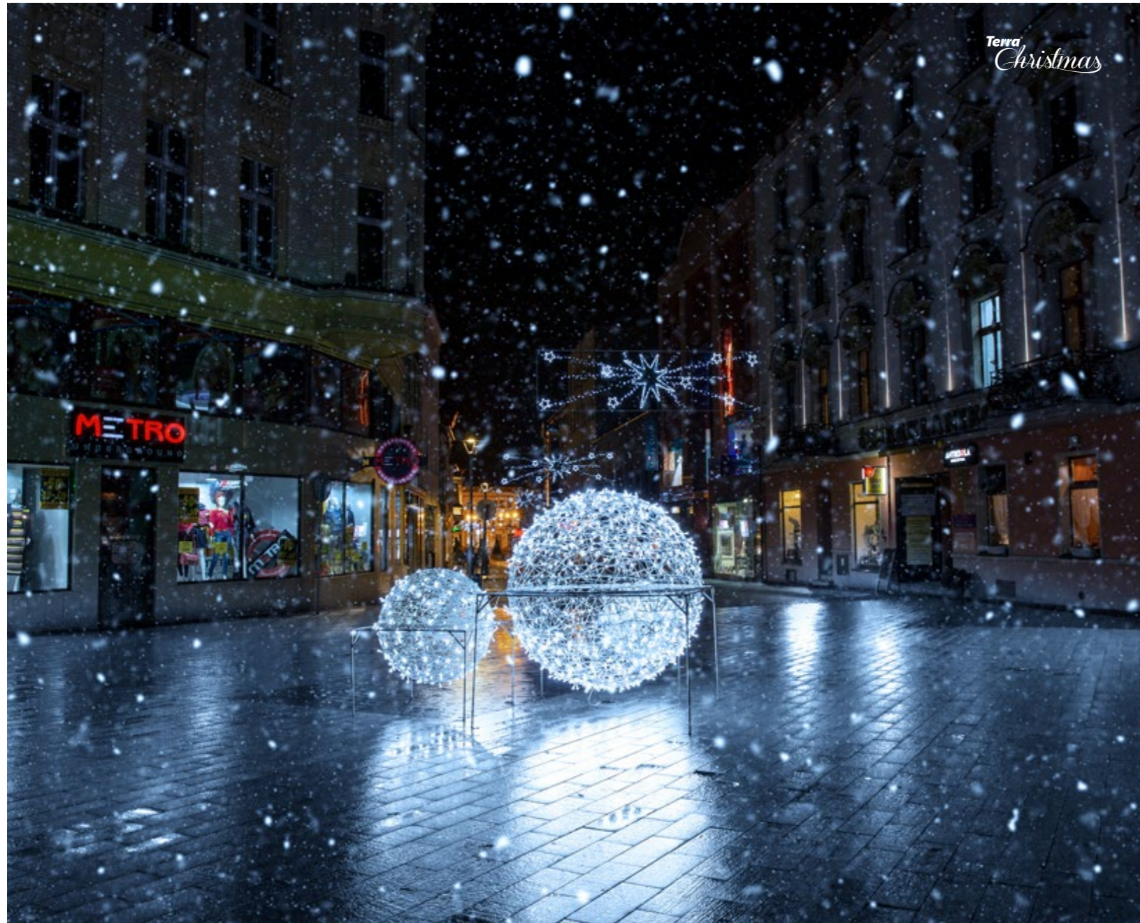
Ajour-Dekorationen Kugel 3D Openwork Decorations Globus 3D