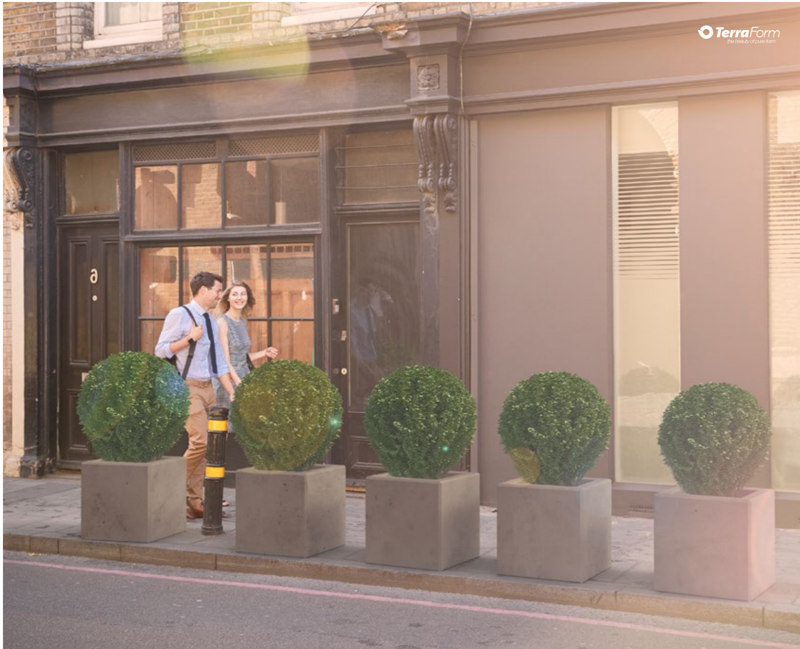
Blumentöpfe Tube 40 Tube 40 pots