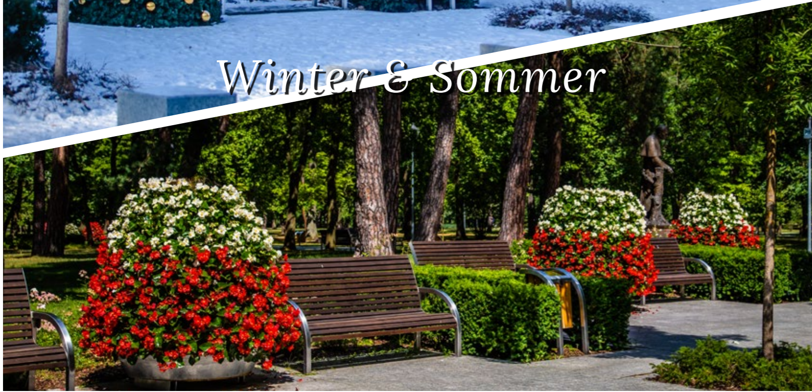
Weihnachtsüberzug Terra Christmas Tree & Blumentürme Terra Christmas Tree Covers & The Flower Towers