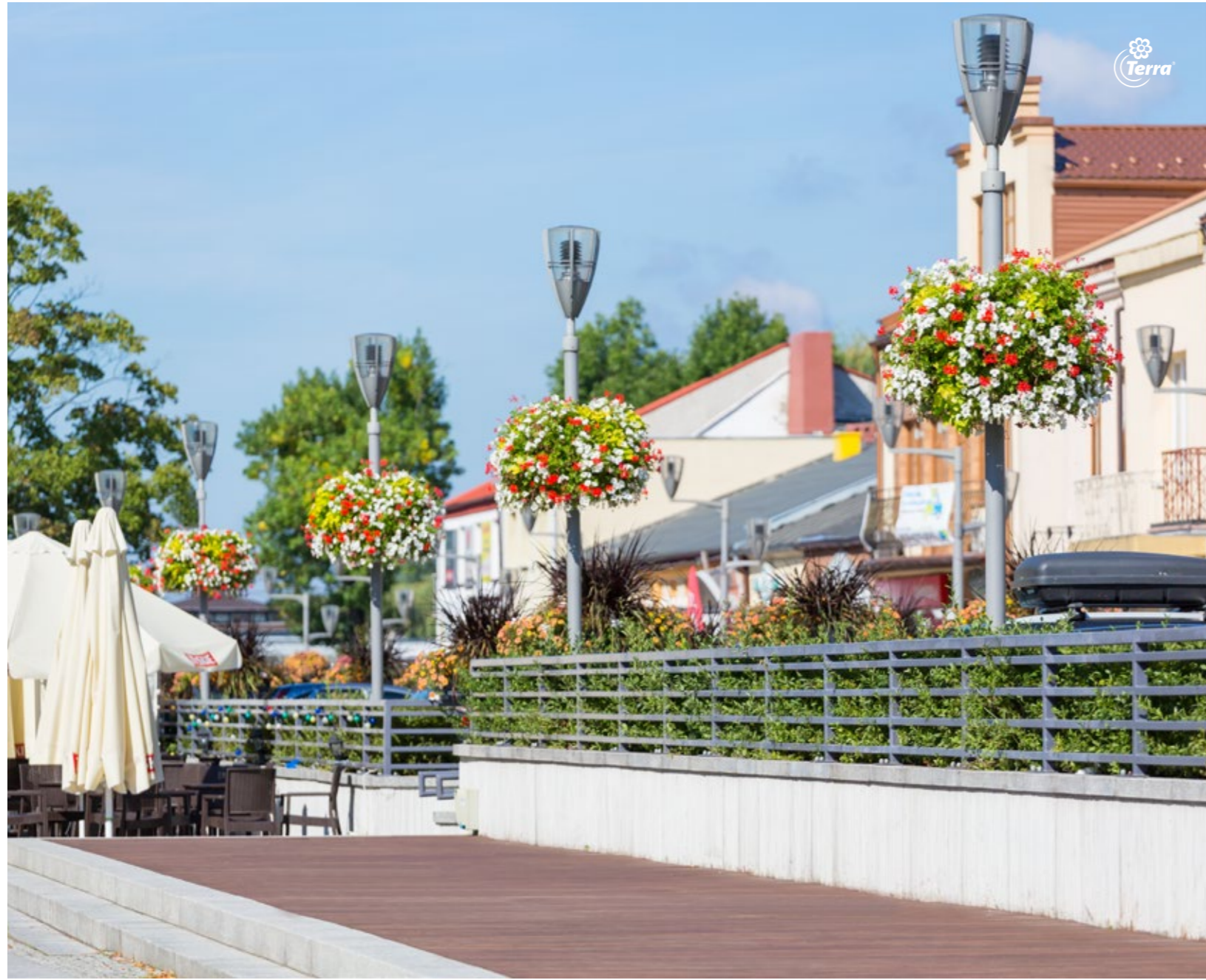
Blumenampeln W600/2 Hanging Flower Towers W600/3