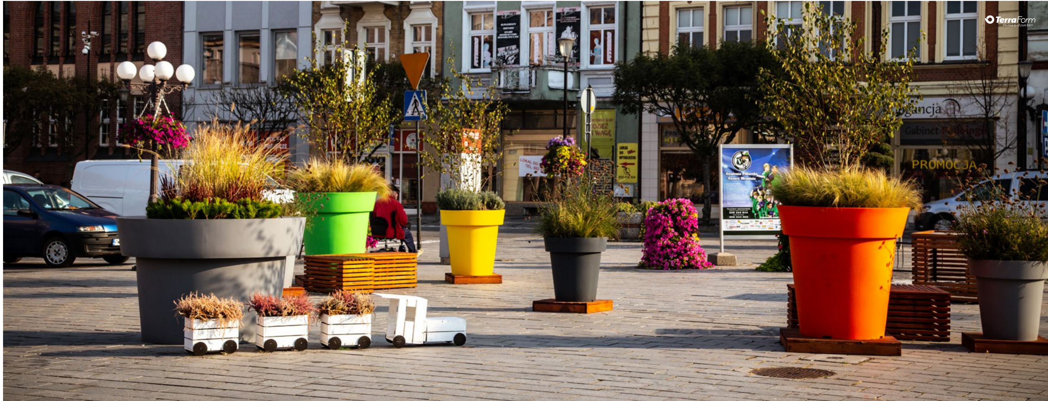
Blumentöpfe Gianto Tablo & Gianto Classic 120/95/80 Gianto Tablo pot & Gianto Classic 120/95/80 pots