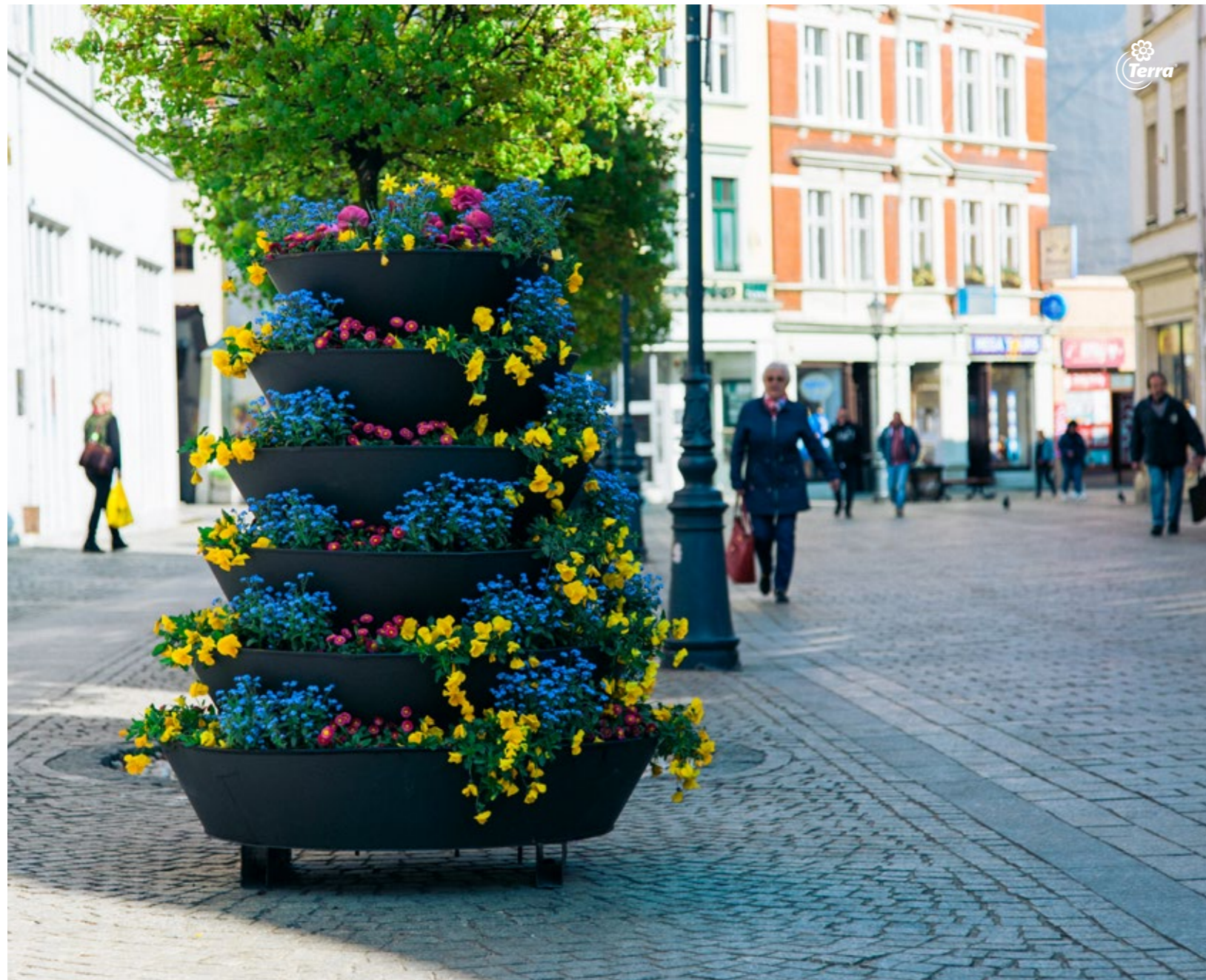
Blumenturm H1200 The Flower Towers H1200